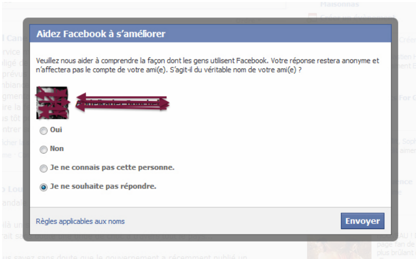
Image 2: fenêtre d'information Facebook sur les “vrais noms”, (In: NIKOPIK, 2012)

Cette disposition est immédiatement vue comme un dispositif de dénonciation et déclenche de nombreux débats autour de la question morale. Le blogueur Nikopik s'en émeut et contacte Facebook qui lui fait cette réponse: