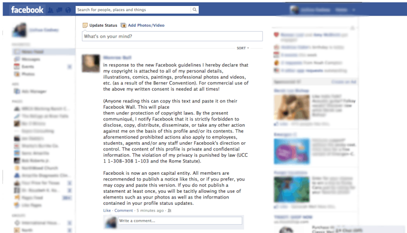
Image 1: texte du Facebook Copyright Hoax ( http://expioconsulting.com/confusion-facebook-guidelines/ )

Un bon exemple de cette approche est la manière dont a été reçu le " Facebook Copyright Hoax ", ce message que les utilisateurs de Facebook relaient régulièrement depuis 2012, afin de protéger leurs contenus d'une éventuelle utilisation commerciale par le réseau social. En voici le texte original en anglais ( la version française étant issue d'une mauvaise traduction automatique ):